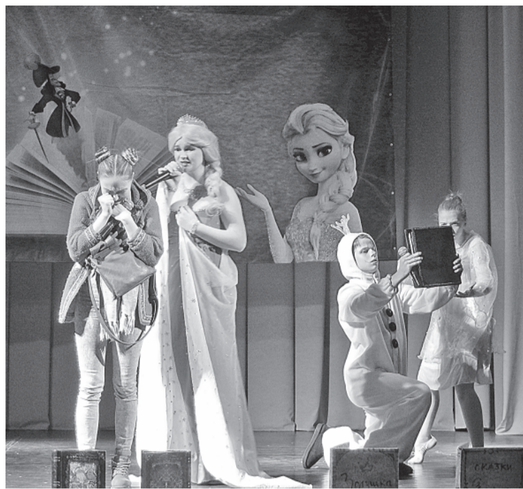
Сцена из мюзикла «Волшебная книга сказок»