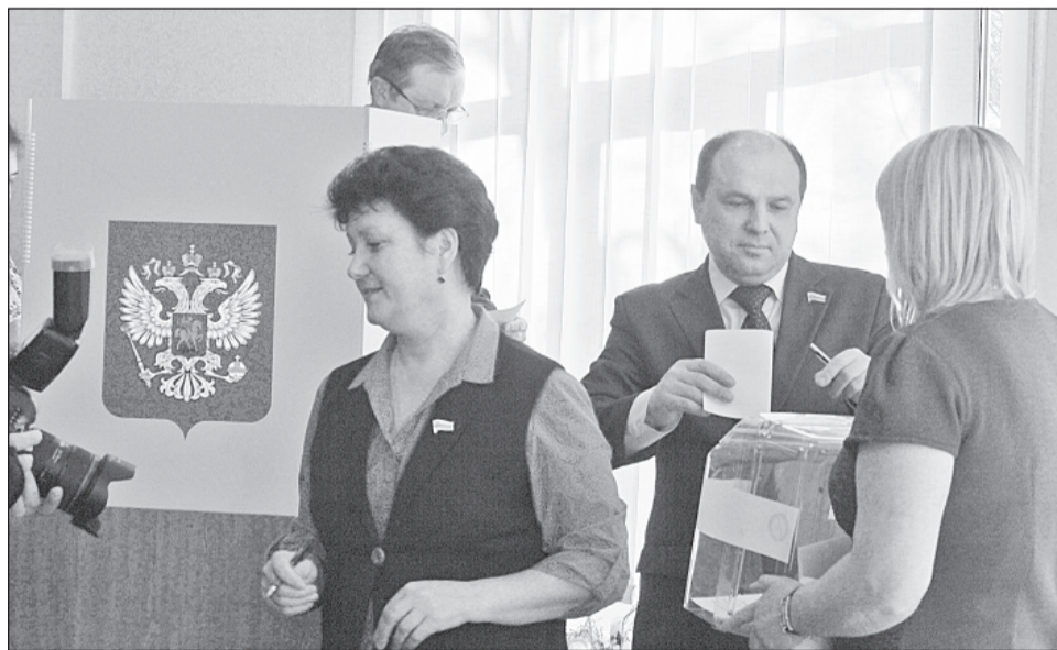
Голосование прошло по принципу прямых выборов